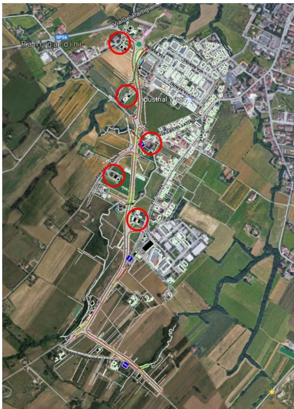
Possibili recettori coinvolti dall'impatto acustico della nuova infrastruttura